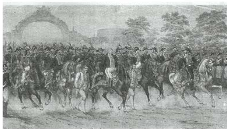
Entrada triunfal del Ejército Trigarante a la Ciudad de México, el 27 de septiembre de 1821.