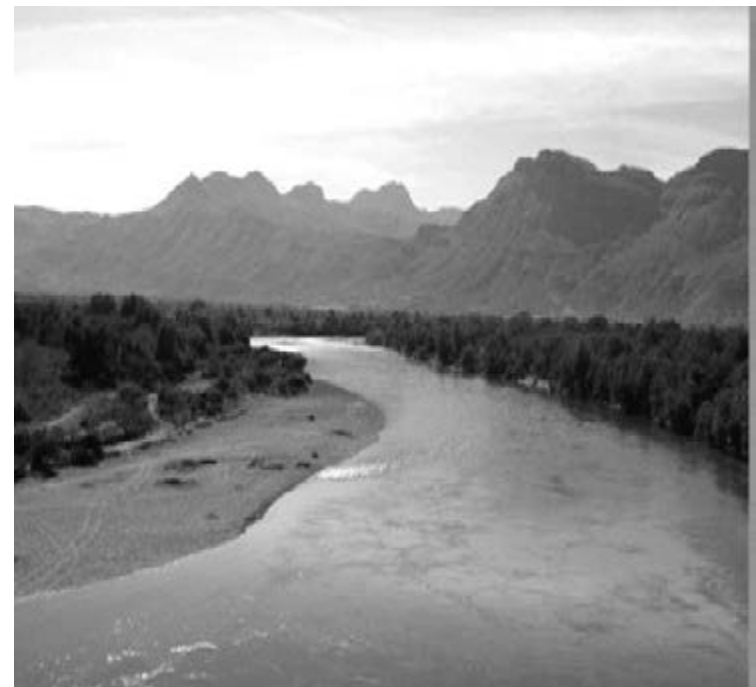
Paisaje calentano.