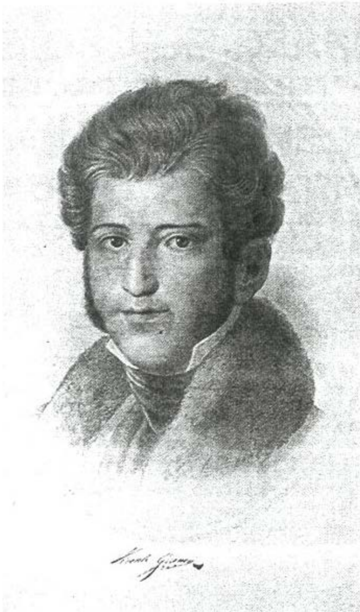
Retrato de Vicente Guerrero. Tutino, p-7