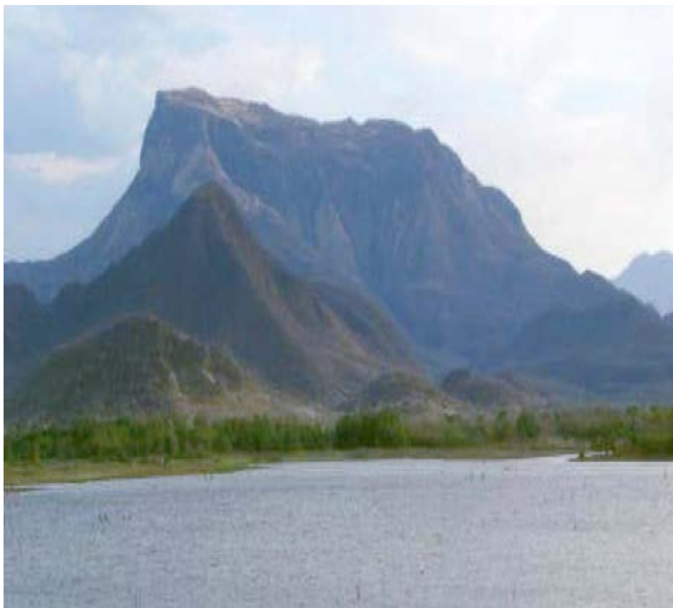
Fuerte de Barrabás, en Zirándaro, epicentro de las Campañas Militares del General Vicente Guerrero en Tierra Caliente.