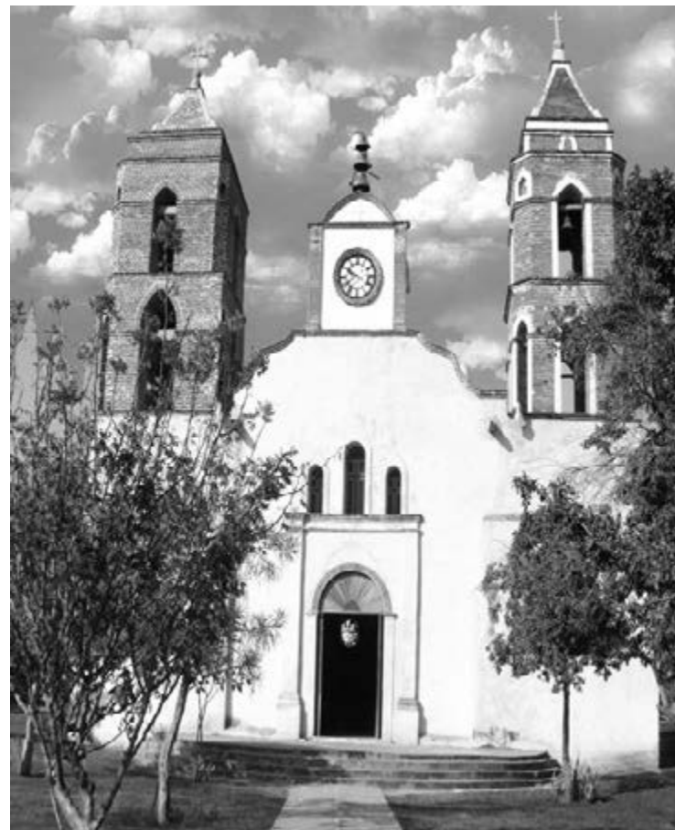
Parroquia de Zirándaro, donde se refugiaron los realistas a finales de septiembre de 1818; después de siete días huyeron del sitio de Guerrero y Montes de Oca. [Imagen tomada de Internet].

23 de abril. Guerrero deja Barrabás y se dirige a la Sierra