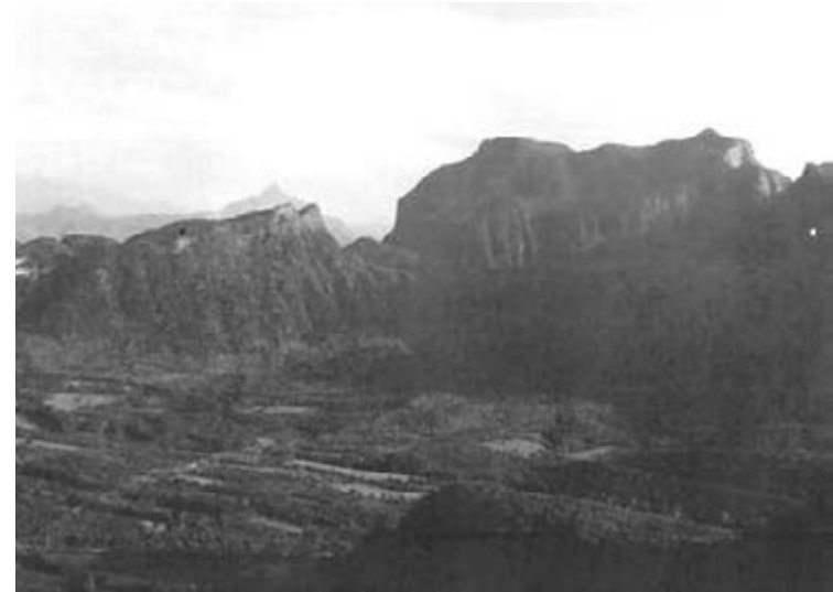
Cerro del Águila. Guerrero lo fortificó en 1817.

Fueron, pues, las riberas del río Balsas, el oasis donde las tropas insurgentes acamparon –disfrutando los dramáticos contornos de sus cerros coronados de rojizos peñascos que hicieron eco a sus disparos (García Márquez hubiera imaginado gigantes molaes de dinosaurios) a la sombra de tupidas pinzaneras, de frondosas zirandas (amates), ahuijotes y de hermosas cahüingas (especie de mezquites), a cuyas sombras, tantas veces, Guerrero descansó, durmió y soñó... a tres años de que consumara la Independencia, a once de que fuera el presidente de la nueva república, y a treinta de que el héroe epónimo trazara a lo largo y a lo ancho, a pie o a caballo, el territorio que merecida y orgullosamente lleva su nombre: Guerrero.